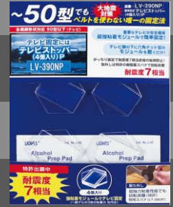
こんなテレビ脚と脚裏でも