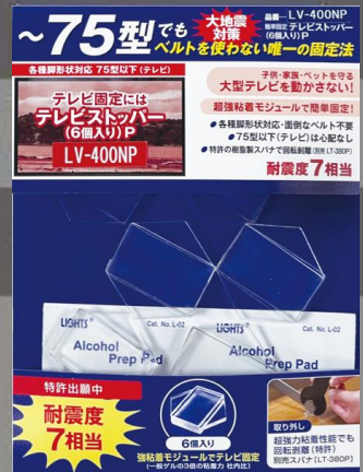
こんなテレビ脚と脚裏でも

● 簡易取付 (テレビの裏のネジ止ベルト付け不要。 脚と床との間に貼り付けるだけ)